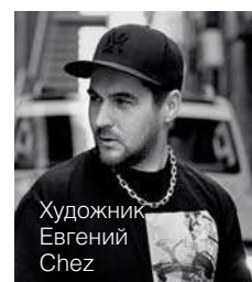
Художник Евгений Chez